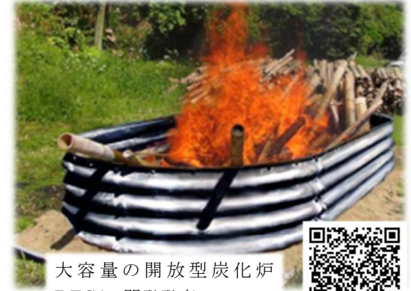
大容量の開放型炭化炉 DECA2 開発発売