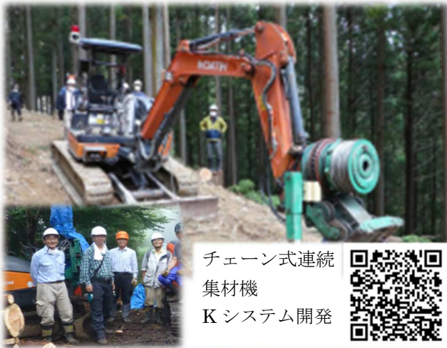
チェーン式連続 集材機 Kシステム開発