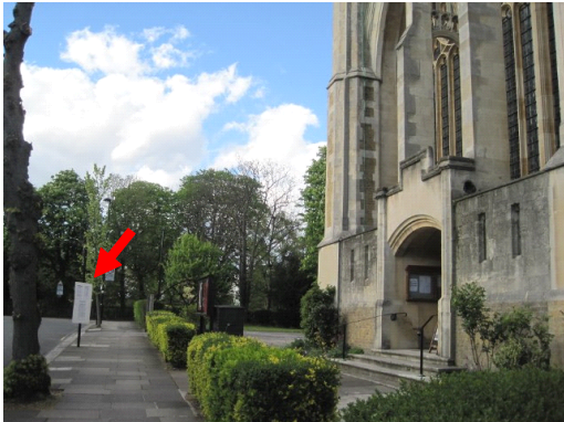
写真① 教会の前に建てられた選挙公報板

更に落選すると没収される供託金 300 万円（小選挙区）、600 万円（比例）を含むと三バンと言われている地盤（組織）、看板（知名度）、鞆（資金）が無い場合は立候補は不可能で、結局三バンを持っている二世、三世議員が幅を利かせ、それらの多くは政治家の資質を持っているか疑わしい者も決して少なくありません。この事は優秀で政治への情熱を持った者の政治家への道を閉ざしていることになり誠に嘆かわしいことでもあります。